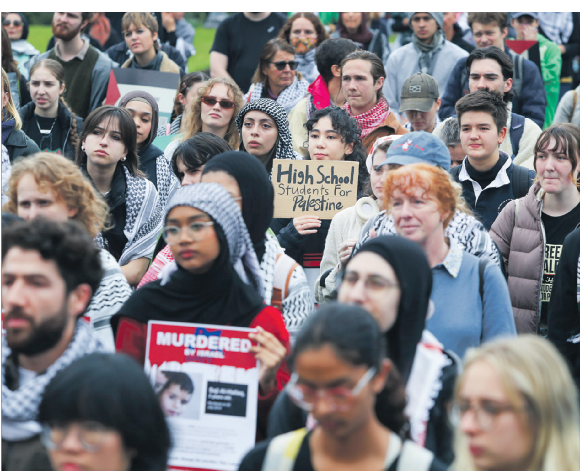
من التظاهرة امام جامعة سيدني أمس