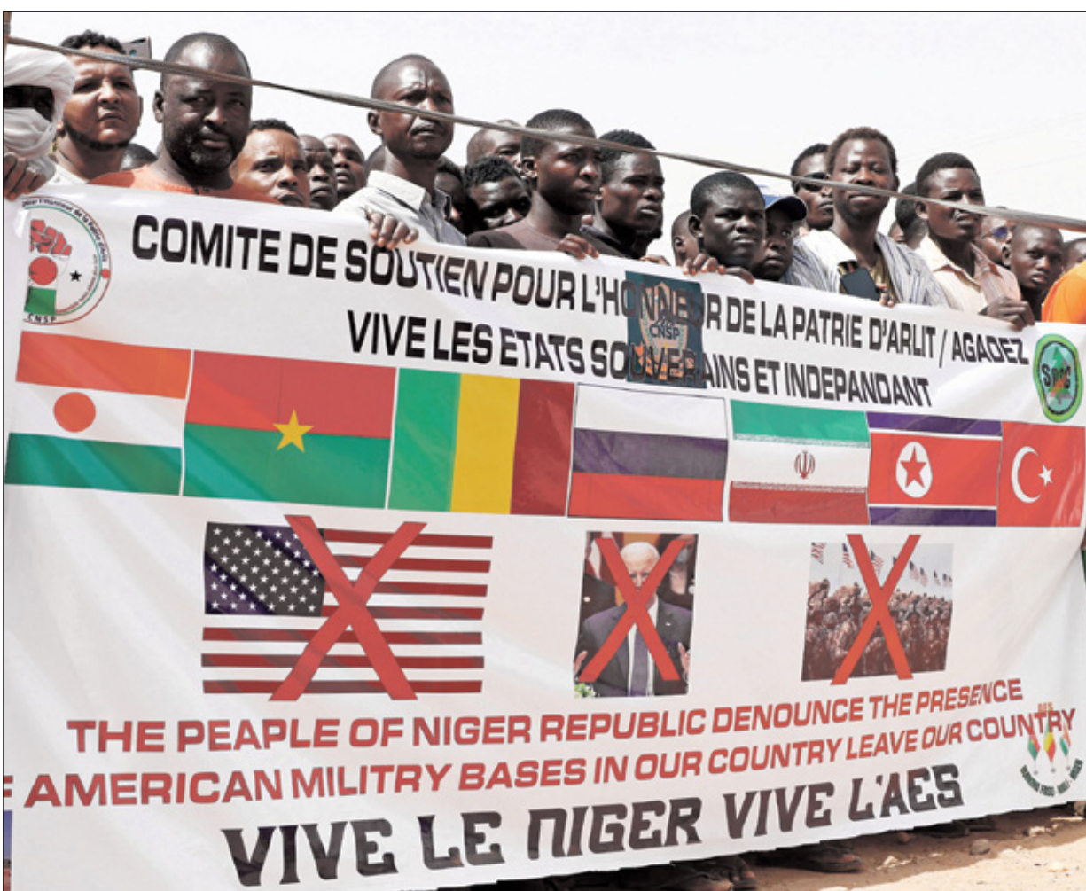
تظاهرة في اغادير رفضاً لوجود الأميركيين، 21 أبريل الماضي

مع القوات الأميركية بعدما دخلت القاعدة الجوية 101، وإنما تستخدم مكاناً منفصلاً في القاعدة، والتي تقع بجوار مطار ديوري حمامي الدولي، في العاصمة النيجرية نيامي. وأضاف المسؤول أن الوضع «ليس