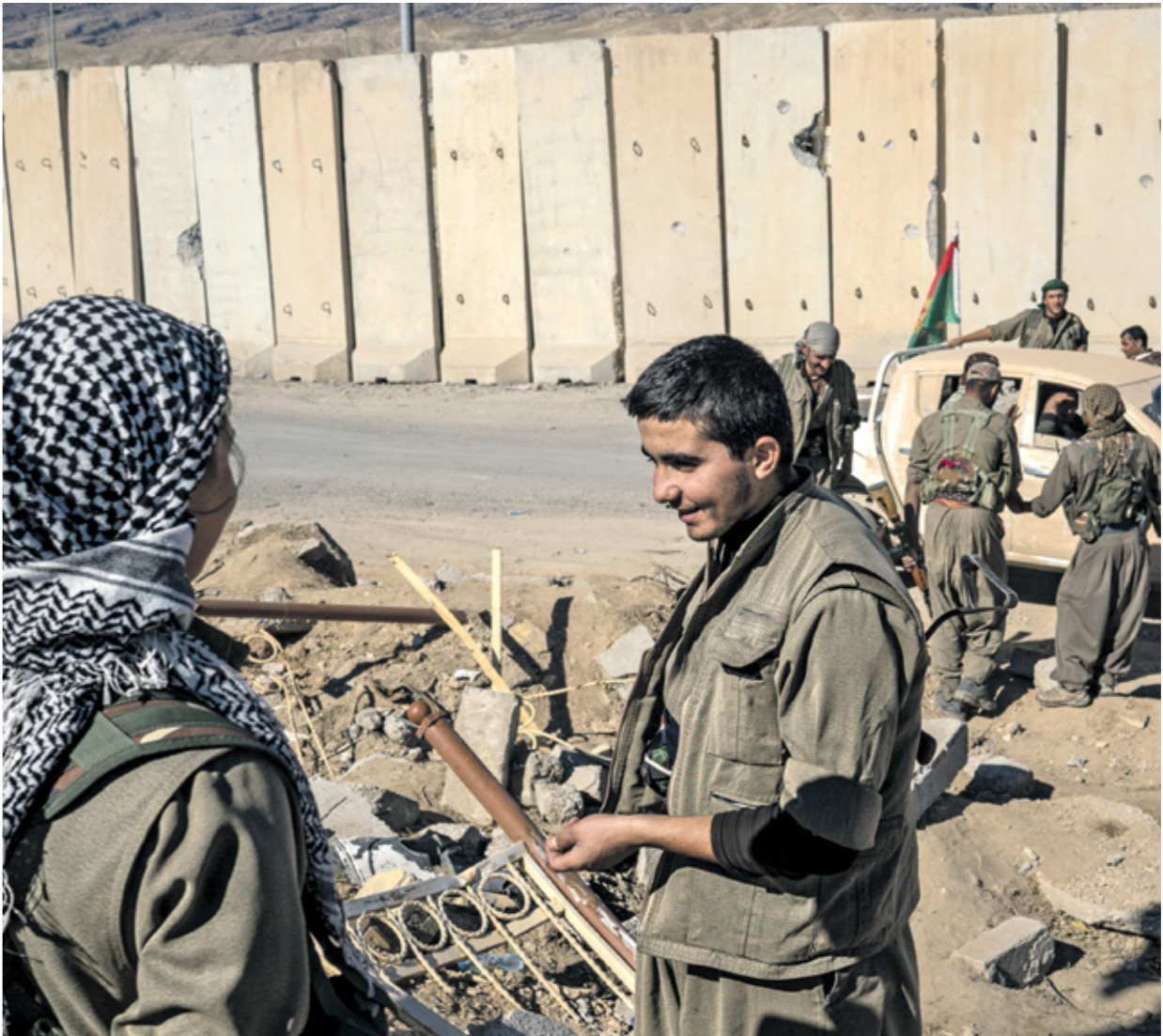
عناصر من «العمال» في سنجار، نوفمبر 2015

يبدو ان القوات التركية تمهد لعملية برية داخل العراق لملاحقة عناصر حزب العمال الكردستاني، مع تكثيفها عمليات استهدافه، بعد ايام من احتتام الرئيس التركي رجب طيب اردوغان زيارة إلى العراق، والكشف عن موافقة عراقية مشروطة لشن العملية