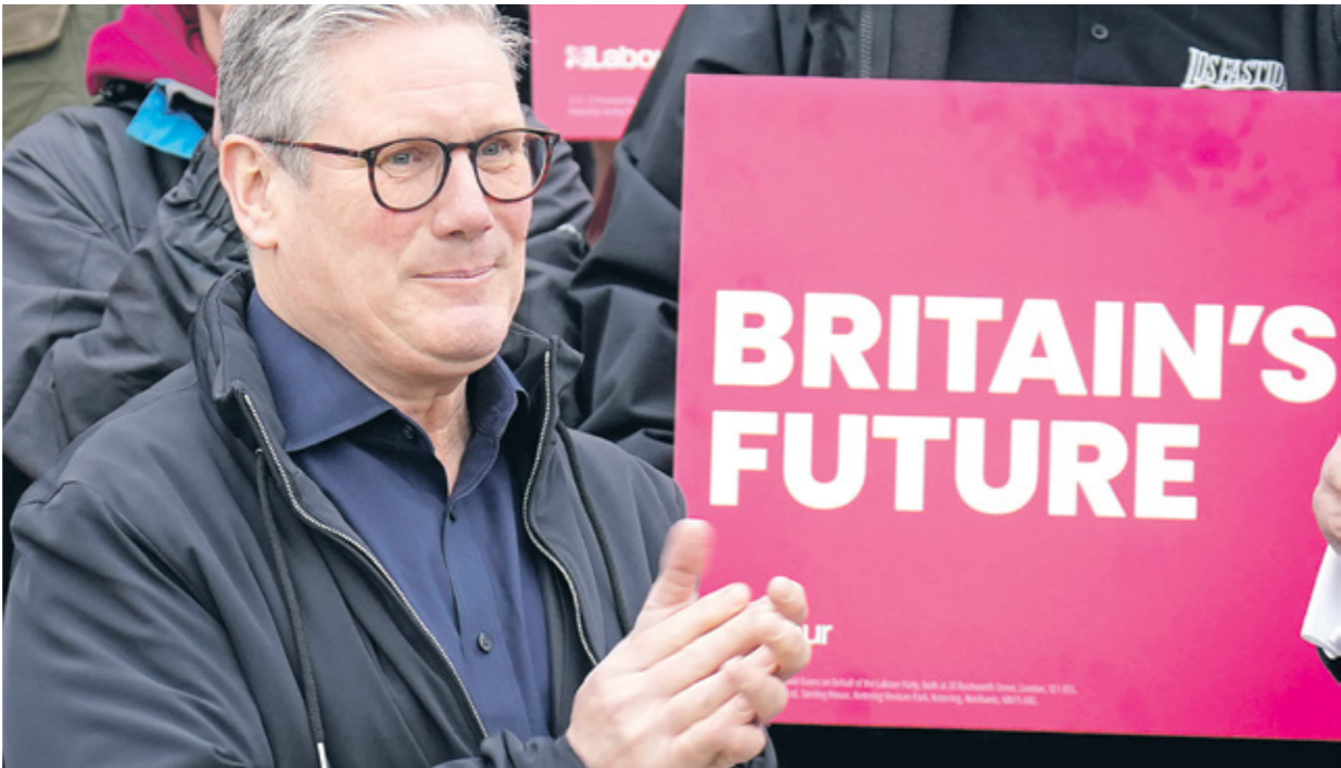
ستارمر في بلاك بول، لندن

وأظهرت النتائج الأولية للانتخابات البلدية، أمس، تمكن حزب العمال بقيادة ستارمر، من تحقيق مكاسب مهمة في حوالي 500 مجلس بلدي في عموم البلاد، وتمكن الحزب بحسب وكالة «أسوشيتد برس»، من استعادة السيطرة على بلديات خسرها منذ عقود، وبحسب توقعات متابعين، فإن حزب المحافظين قد يخسر حوالي نصف المقاعد البلدية الالف التي تأسس للمحافظة عليها، أول من أمس. وقالت النائبة إن الاء السنين ستارمر والعمال» تجلّى في بعض المناطق التي تغطتها جالية مسلمة كبيرة، حيث منى مرشحو الحزب بخسارت عدة، بسبب موقف ستارمر المؤيد لإسرائيل في عدوانها على قطاع غزة، ومن المتوقع أن تعلن النتائج النهائية اليوم