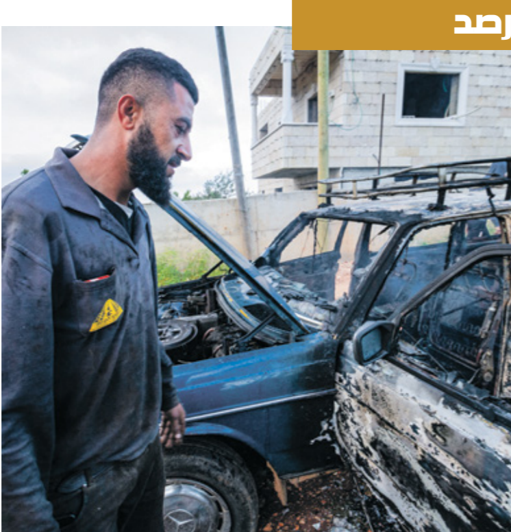
فلسطيني، امام سيارة احرقها مسوطنون في حفرة ايريك العاصي

وفي أستراليا، احتشد مئات المحتجين على حرب غزة، امس، أمام جامعة سيدني، مطالبين بإبائها بسحب استنمراتها من الشركات المرتبطة بعلاقات بايسرايل. وكان نائب مستشار الجامعة، مارك سكوت، أكد، بحسب رئاسة الحكومة الفرنسية، وتحدثت صحيفة «الوموند»، أمس، عن دخول امس طلاب من «ساينس بو» - باريس، في إضراب جوع، سيتواصل (حتى إجراء تصويت في مجلس الجامعة على الشراكات مع جامعات إسرائيلية»، بحسب «الجثة فلسطين».